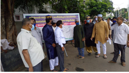
Flexi Signature Campaign at 80' Road Junction, Akkayyapalem.