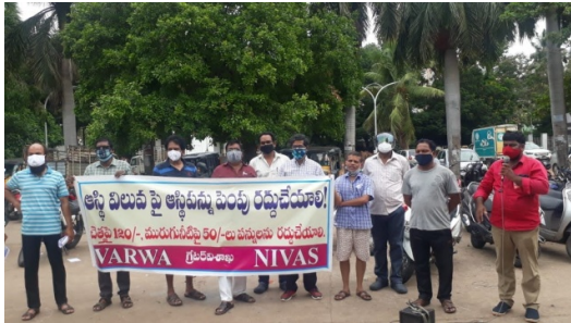
At Rythu Bazaar, MVP Colony