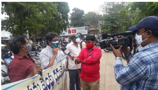
At Rythu Bazaar, MVP Colony