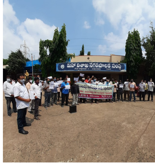
Dharna at Gajuwaka Zonal Office