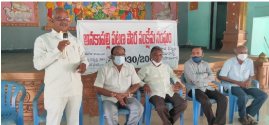
Meeting in Anakapalli