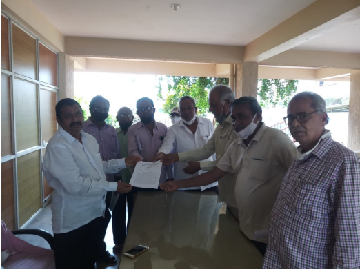
95 th Ward Sri Mummana Demudu