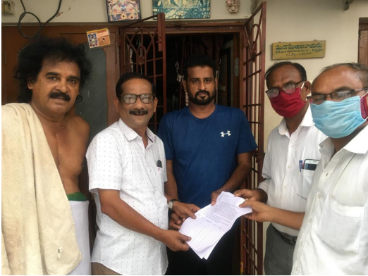
26 th Ward Corporator