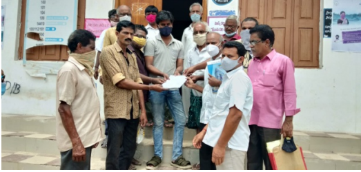
Protest at 84 th Ward , Anakapalli and submission of a memorandum to officials