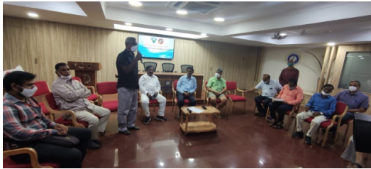
Round Table meeting at Vizag Chamber of Commerce and Industry (VCCI)

ఆస్తి విలువ ఆధారంగా పన్నులు పెను భారమే !