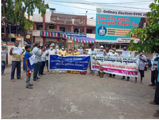
Dharna at Gnanapuram