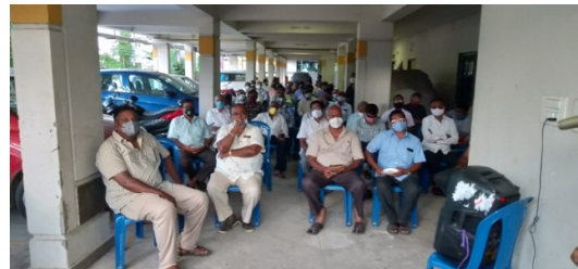
7 th Zone meeting, Anakapalli