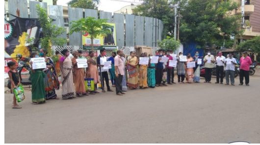
At Rythu Bazaar, Akkayyapalem