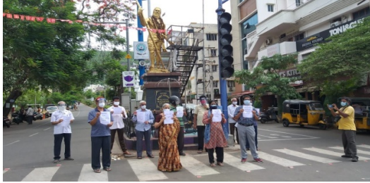
At Alluri Sitarama Raju Statue, Seethammadhara