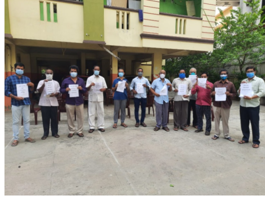
At Sree Complex, Near Venkojipalem Petrol Bunk