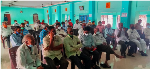
Audience in Anakapalli meeting