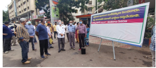
Flexi Signature Campaign at Rythu Bazaar, Seethammadhara