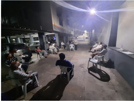
At Mytri Residency, TPT Colony, Seethammadhara