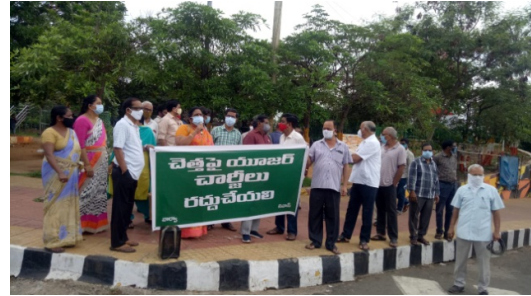
Dharma at GVMC Gandhi Statue opposing the decision of the GVMC Council hiking the User charges on Garbage collection