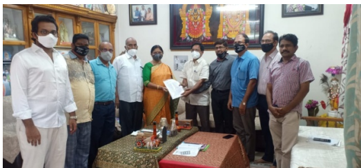
Submission of a Memorandum to the Asst Zonal Commissioner, Anakapalli