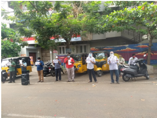
At Dr VS Krishna College, Maddilapalem