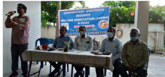
7 th Zone Meeting, Anakapalli