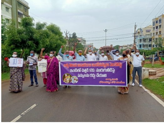
Padayatra in Viman Nagar