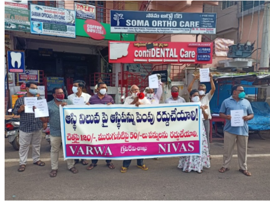
At Rythu Bazaar, Akkayyapalem