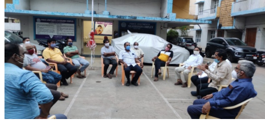
At Prince Apartments, Shivajipalem