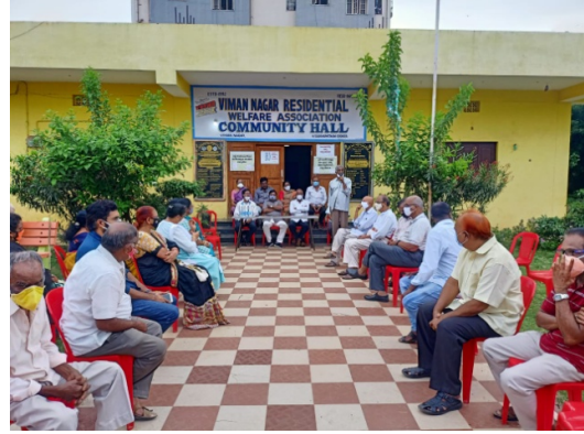
Meeting at Kakani Nagar

Leadership of VARWA and Nivas met the Hon'ble Mayor at her residence and submitted a memorandum with 5000 signatures.