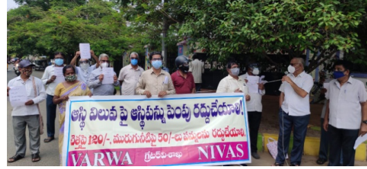
Dharma at GVMC,