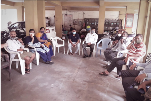
Meeting at Jagannadhapuram, Akkayyapalem